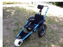
2016 Oasi Marconi Sedia per percorsi accidentati