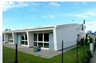
2016 Sisma del Centro Italia Raccolta fondi con Croce Rossa Italiana