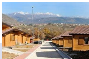
2009 Sisma in Abruzzo Villaggio Sanofi