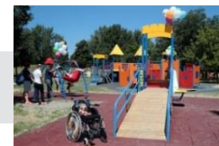
2018 Parco Amendola Giostre inclusive