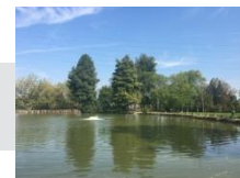
2017 Laghetto Modena Est