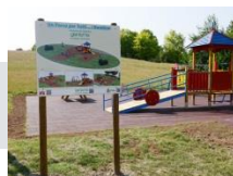
2015 Parco Ferrari Giostre inclusive

in occasione delle iniziative a Modena per la Giornata delle Malattie Rare