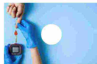
Diabete di tipo 2: soddisfazione, ma anche