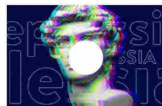
Epilessia: come migliorare la presa in carico