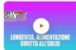
Longevità, alimentazione, diritto all' oblio. Dentro la