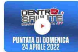
Online la puntata di domenica 24 aprile