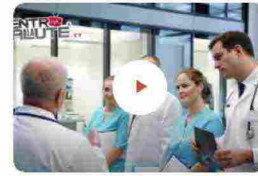
Dentro la Salute, puntata 35