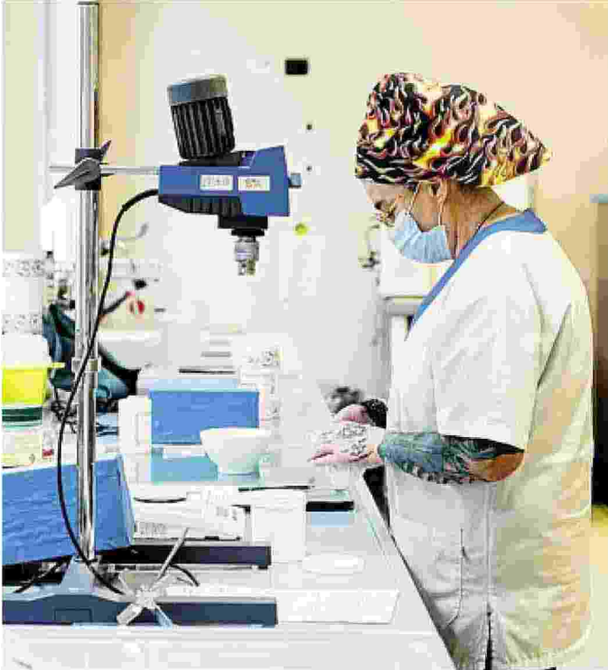
Al lavoro nel laboratorio dell'ospedale Sant'Anna BUTTI